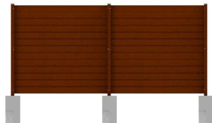
Adapterprofil für Deluxe